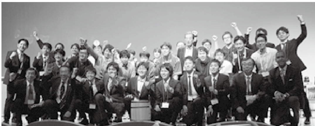
2016年 Dr's Dilemmaの様子